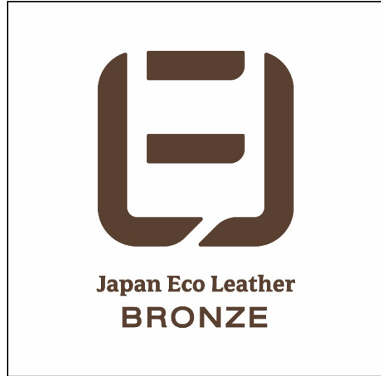
表面(ブロンズの場合)