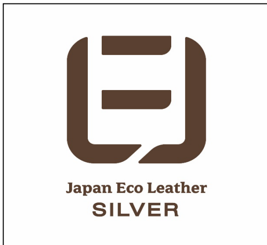
表面(シルバーの場合)