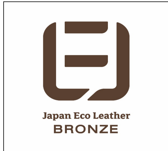
表面(ブロンズの場合)